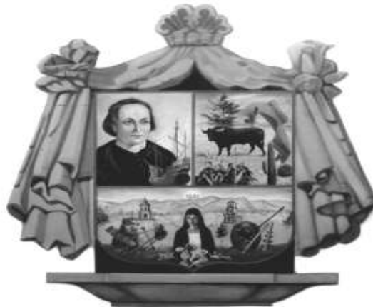
PRESIDENCIA MUNICIPAL COLÓN, QRO.